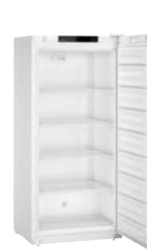
SFFsg 5501 Performance