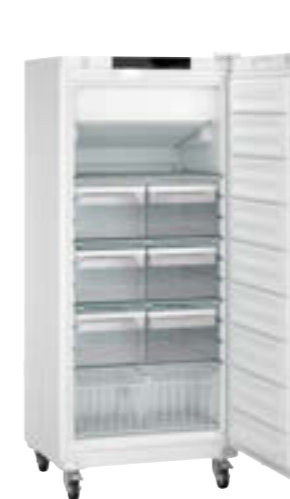
SFFvh 5501 Perfection

Hladilniki in zamrzovalniki Liebherr, posebej razviti za shranjevanje temperaturno občutljivih izdelkov, so skladni z varnostnim standardom CE. Tako izpolnjujejo vse mehanske in električne zahteve za delovanje brez poškodb – vi in vaše osebje pa ste vedno na varni.