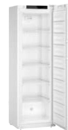
SFFsg 4001 Performance